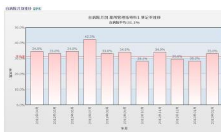
【自病院月別算定率推移画面】