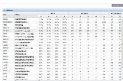
【俯瞰マップ（加算項目）画面】

「病院ダッシュボードVer1.10.0」では、新たに自病院分析機能として、「チーム医療plus」（オプション）を追加しました。これによって、薬剤管理指導料や栄養管理指導料など、チーム医療関連の診療報酬の算定症例数、算定金額、算定率、算定可能症例数、算定可能金額を任意の異なる期間で確認することが出来ます。また、自病院のシミュレーション値として、①算定可能症例全てを算定した場合の金額、②ベンチマークデータの中で最も算定率の高かった病院と同じ算定率だった場合の金額、を表示することが可能となりました。